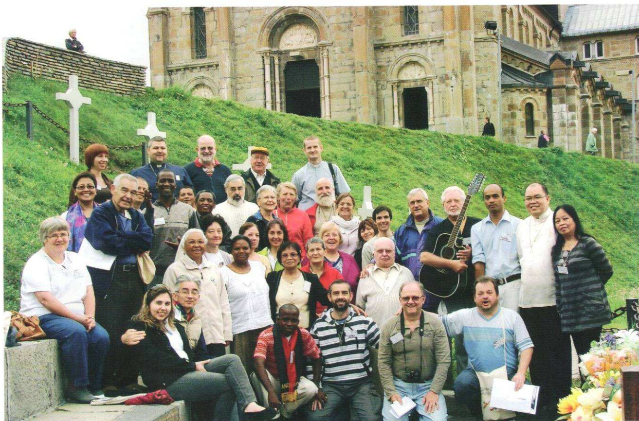
Rencontre internationale des laïcs salettins.